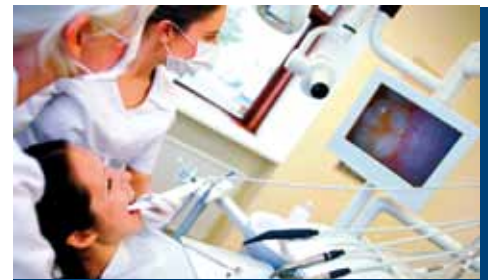
Informationen zum präparierten Zahn(-umfeld) erhalten Zahnarzt und Dentallabor über sog. Intraorale Kameras.

Patienten. Es können z. B. exakte Bohr-/OP-Schablonen erstellt werden, über die der Knochen für das Setzen der Implantate aufgebohrt wird. Die Daten werden zudem benötigt für die digitale Planung des Zahnersatzes sowie die digitale Vorbereitung der Herstellungsdaten für das Gerüst (die Basis) des anzufertigenden Zahnersatzes bzw. für den gesamten Zahnersatz. Mit CAD/CAM-Technologie lassen sich u. a. planen: Veneers, Inlays, Kronen, Brücken, Teil-/Vollprothesen, Suprakonstruktionen (auf Implantaten befestigter Zahnersatz). Die CAD/CAM-Daten werden verwendet für das Fräsen der Zahnersatz-Basis bzw. des gesamten Zahnersatzes aus vorbereitetem Material (z. B. aus hochfester Hightech-Keramik wie Zirkoniumoxid, kurz Zirkonoxid/Zirkon) oder auch für die Fertigung in Lasersinter-Anlagen (sintern = durch Materialschmelzung herstellen). Die digitalen Daten für die Fertigung des Zahnersatzes werden weiterverarbeitet über Fertigungsmaschinen im eigenen Dentallabor oder in externen Fertigungszentren, an welche die Dentallabore die Daten weiterleiten, um z. B. die Gerüste für Brücken fertigen zu lassen. Mit Hilfe digitaler Zahnersatz-Fertigung lassen sich heute kostengünstig besonders auch die immer mehr gewünschten vollkeramischen Zahnersatz-Lösungen fertigen. ■